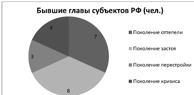
Рис. 2. Бывшие главы субъектов РФ (чел.): политические поколения