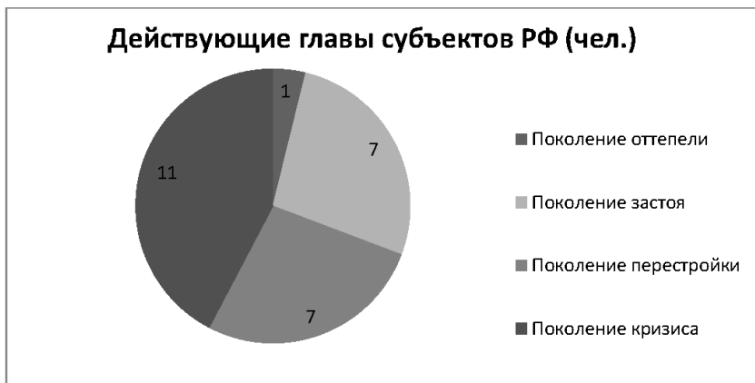
Рис. 3. Действующие главы субъектов РФ (чел.): политические поколения

наверх. Однако главы регионов, как бывшие, так и действующие, сумели преодолеть ограничения, связанные с провинциальным происхождением.