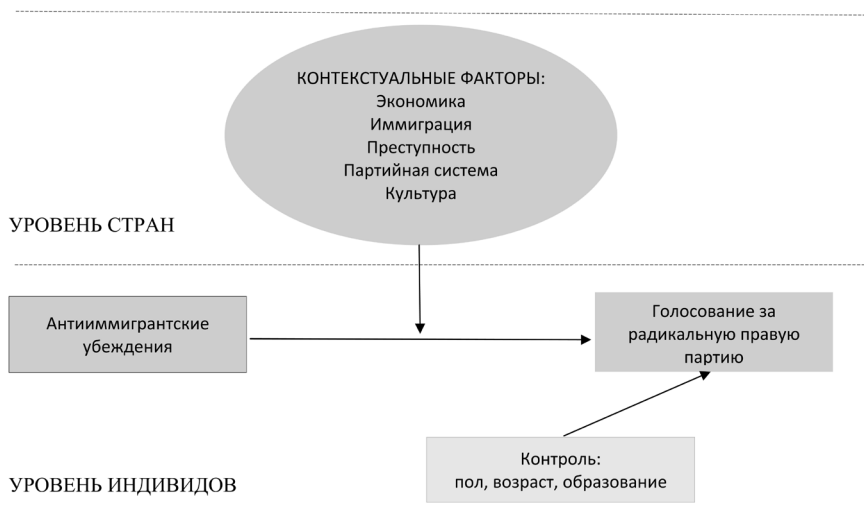
Рисунок 1. Схема анализа голосования за РПП в странах Европы

кое распространение в обществе нетяжких преступлений, таких как кражи (опять же связь слабая). Ни различие культурных ценностей, ни общий показатель постмодернизации не объясняют, почему в одних европейских странах правые националисты имеют значительный электорат, а в других им не удается привлечь на свою сторону избирателей.